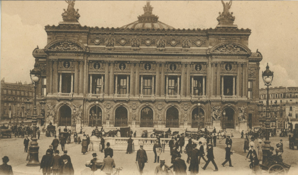
70 PARIS (IX°). — L'Opéra. — LL.