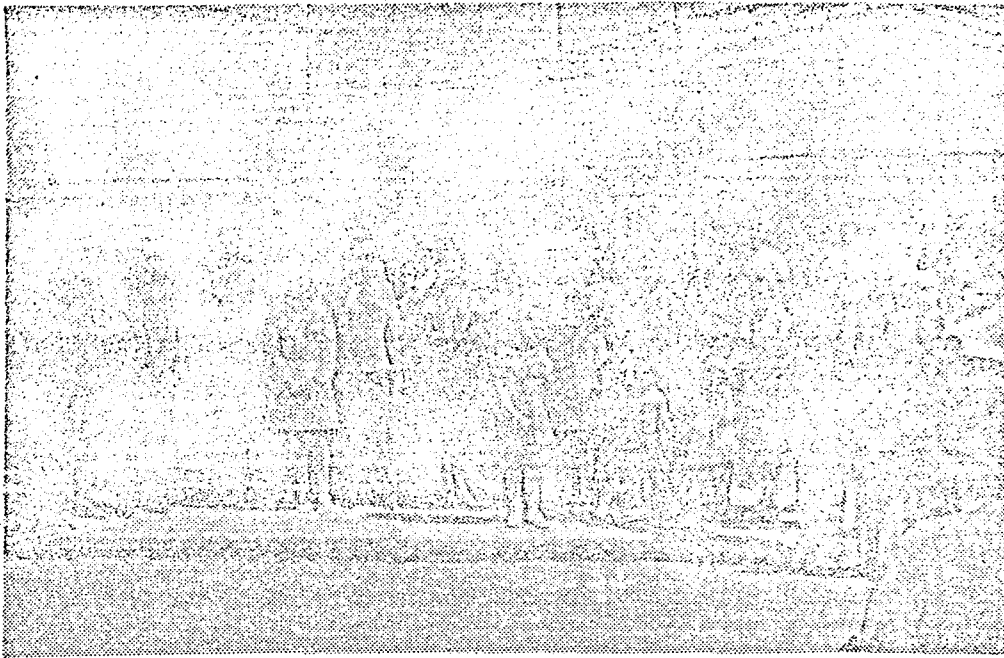
Autoridades e familiares prestigiaram a inauguração da placa da rua José Bonifácio Arruda.