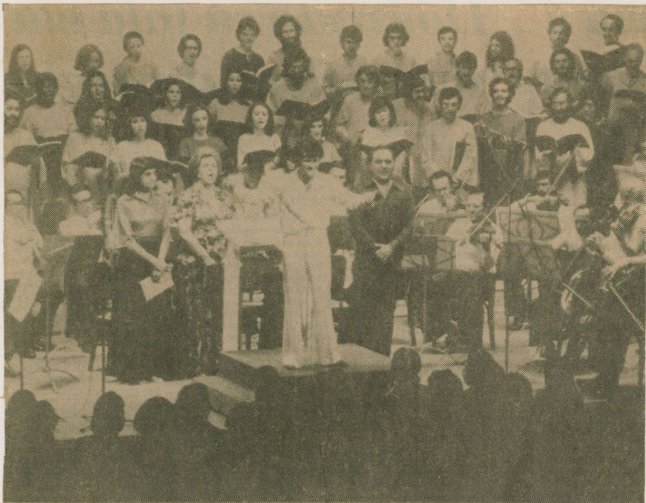
A Sinfônica de Campinas, que já ganhou o prêmio de melhor do Brasil, corre o risco de ser extinta

VEREADOR de Campinas pede a extinção da Orquestra Sinfônica. do de São Paulo, São Paulo, 25 Jan. 1977. - O Estado -