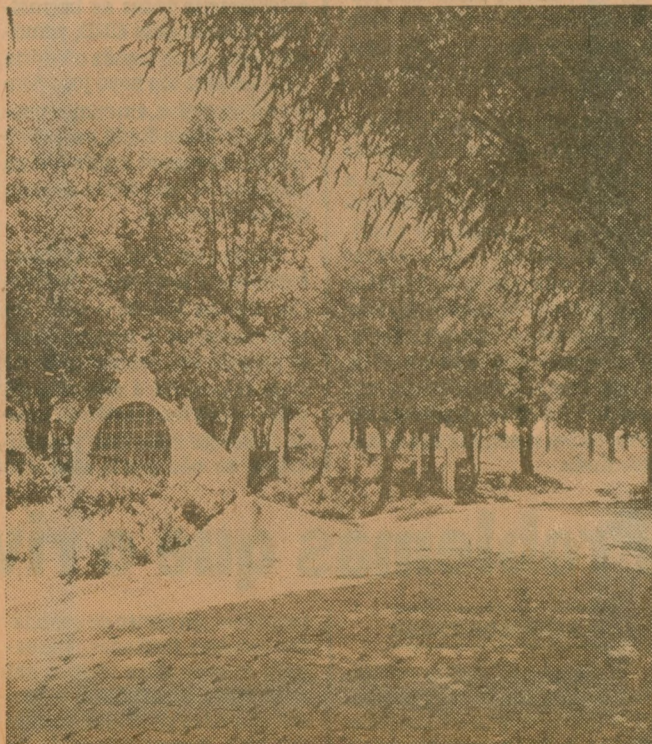
As fontes de Valinhos, uma opção

Outros pontos interessantes de Valinhos: a cascata do Bisoto, a fonte Santa Tereza ou ainda as casas noturnas mais sofisticadas da região, "Labirinto" e "Paraíso".