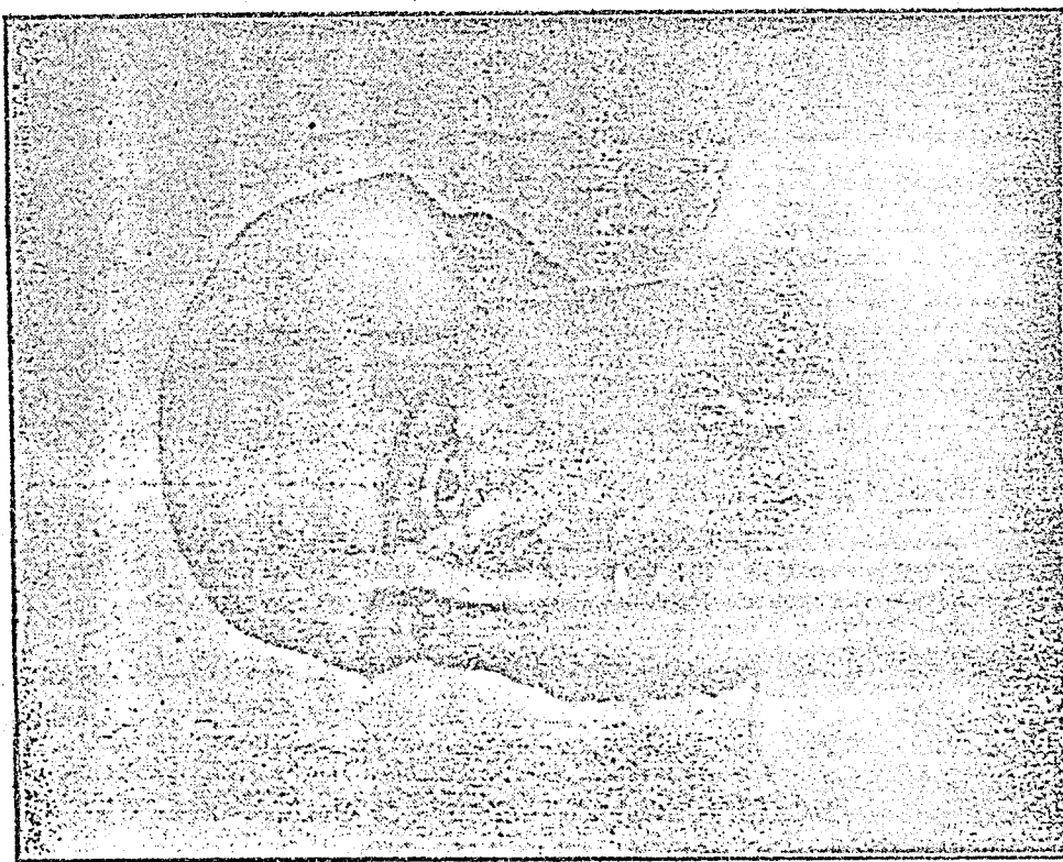
TEODORO I (642-649)

(Extraído da "Bíblia Sagrada", Volume XVII, "Biografia dos Papas", da Editora das Américas, edição de 1952, São Paulo)