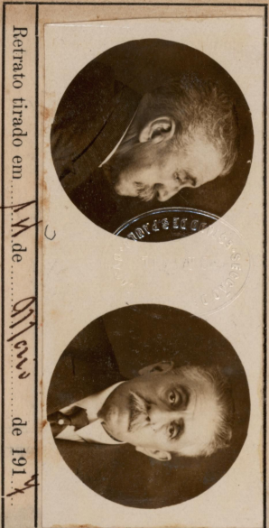
Retrato tirado em 11 de Maio de 1917

Não é valido o retrato que não tiver o sinete em relevo