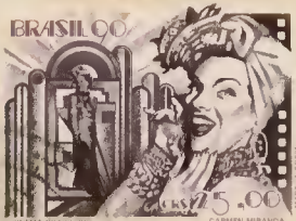
CINEMA BRASILEIRO CARMEN MIRANDA