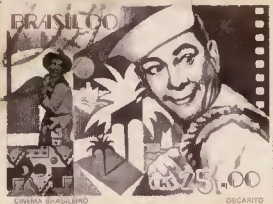
CINEMA BRASILEIRO OSCARITO