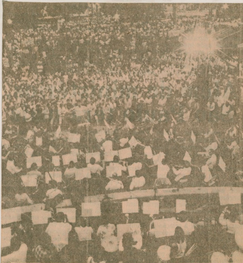
Sinfônica das Diretas deverá tocar na posse de Tancredo