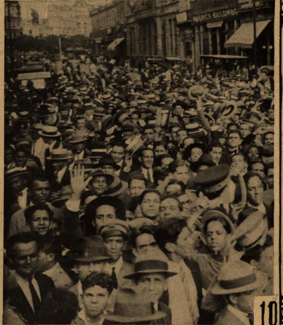
9—Reminiscência do vôo do Jahú hoje quasi concluido, uma vez que o Avião da Perseverança se acha em terras patrias perto do ponto terminal da sua trictoria: o avião brasileiro ao chegar ao porto de Gibraltar. 10 a 13 — Varios aspectos colhidos nas ruas do Rio de Janeiro, com o povo a vibrar de entusiasmo á noticia da partida do Jahú de Porto-Prata, com destino ao Brasil. 14 — O aviador João Ribeiro de Barros, commandante do Jahú , em Porto-Prata, junto do monumento que ali foi erguido a Sacadura Cabral e Gago Coutinho. 15 — A terra de Ribeiro de Barros vibrando de patriotismo á noticia da traveessia do Atlantico pelo avião brasileiro. Vê-se na gravura a veneranda senhora Ribeiro de Barros, na sua residência, em Jahú , rodeada por pessoas amigas e admiradoras que lhe foram levar as mais expressivas demonstrações de carinho pela victoria dos descendentes dos Bandeirantes.