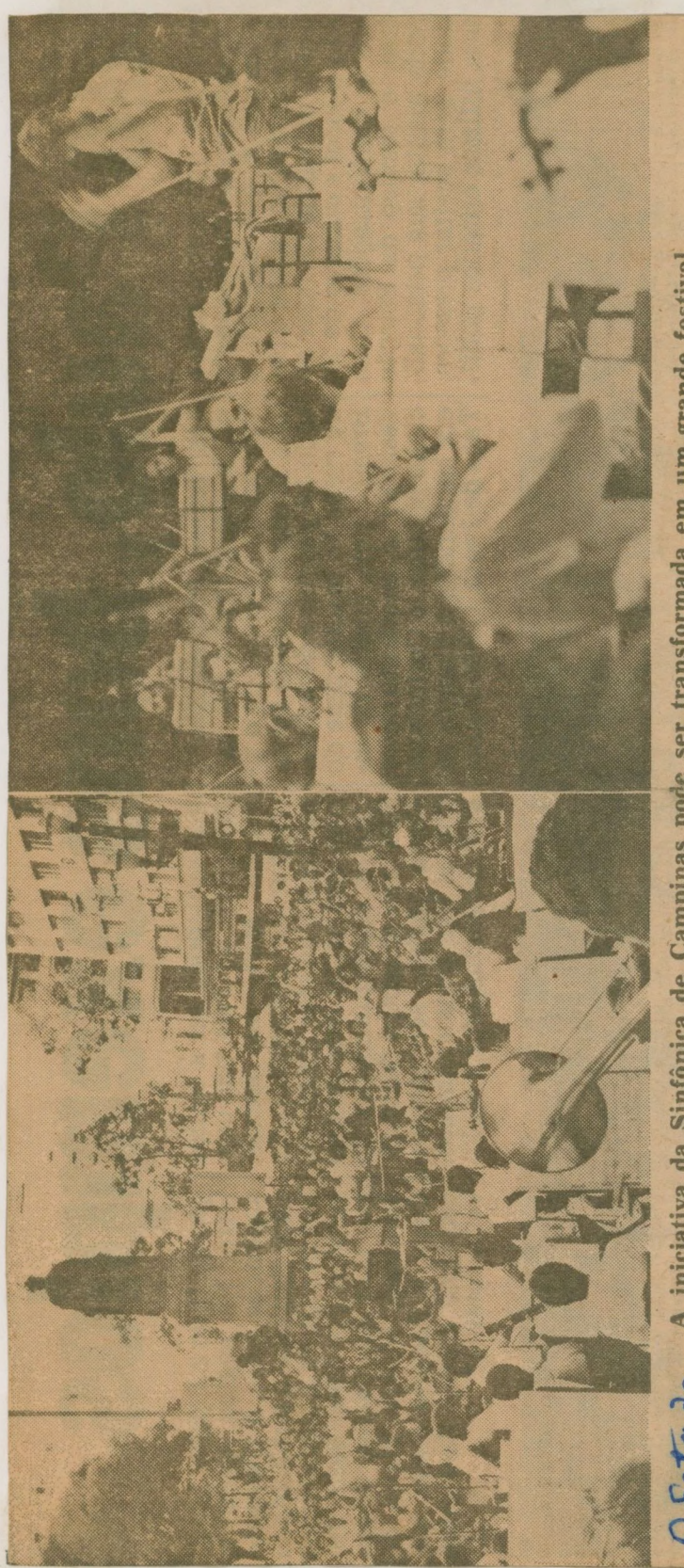
O Estado de A iniciativa da Sinfônica de Campinas pode ser transformada em um grande festival

OLIVEIRA, Margarida de. Semana de ballets, mais um sucesso musical da Sinfônica de Campinas. O Estado de São Paulo, São Paulo, 20 dez. 1981.