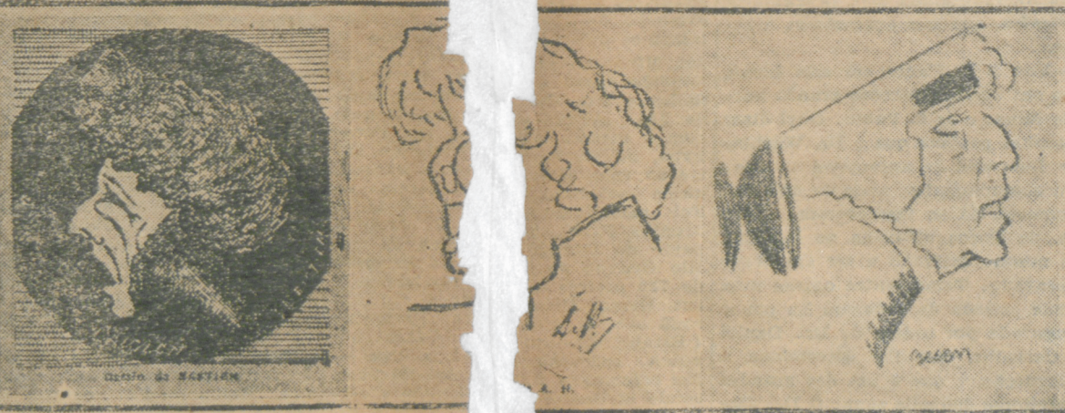
Desenhos avulsos de caricaturistas differentes, os nomes estão gravados juntamente. O primeiro representa, como allas está indicado, o travesti. As outras duas caricaturas e gestos habituaes da grande artista.

ras e de charges martelladas, taes as produzidas por occasião das suas representações na America. Pois não houve um jornal parisiense que abriu em sua honra um concurso de caricaturas, qual se tratasse de um monumento destinado a sobreviver-lhe? A arte e a manieira de fazer a caricatura de madame Sarah Bernhardt com uma vasovra e cem outras extravagancias do mesmo genero ficaram sempre como outros tantos documentos vivos da sua popularidade. E, depois, a obra dos promotores e dos adherentes do Salão da Incoherencia. Porque Sarah não teve apenas os seus pintores, os seus gravadores, os seus medalhistas officiosos: teve os seus caricaturistas. Sem o querer, ella foi de certo modo a inspiradora do Salão dos Incoherentes que, em dado momento, atraiu Paris inteiro. Na imagem, como na canção, viu-se nascer o sarahberhardismo, popularizando os altos feitos da actriz e da super-mulher.