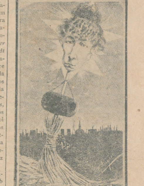
Este desenho de M. Inque é uma bizarra allusão á extrema magreza que, em dado momento, foi um attributo physico, quasi proverbial, da singular artista.

Satira, troca, jovialidade, todas as formas de caricatura a popularizaram assim á compita. E ella foi, para os lapis, um tal elemento de successo que não está fóra de expectativa ver erigir-se um bello dia algum monumento com esta dedicatória, a que não faltaria nem verdade nem originalidade.