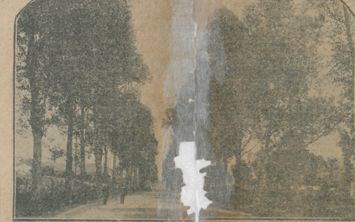
AVENIDA JOÃO PINHEIRO