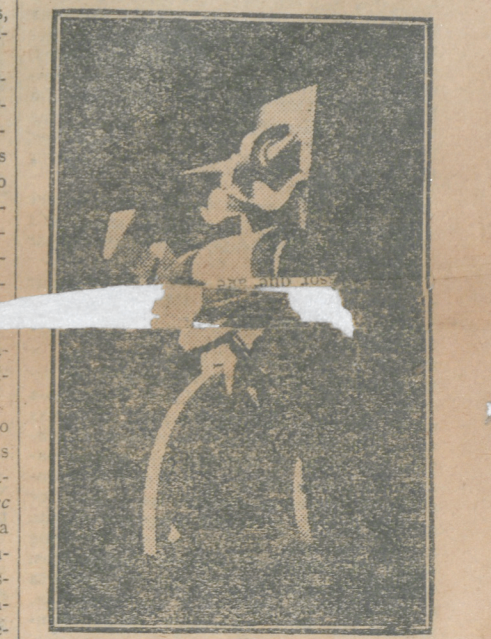
Personagem mecânica da scena futurista

— Estou realmente commovido pela fidelidade e pela finissima gentileza com que os collegas me têm tratado nesta cidade. Bem quizera eu não dizer-lhes um simples obrigado, mas abraçal-os a todos.