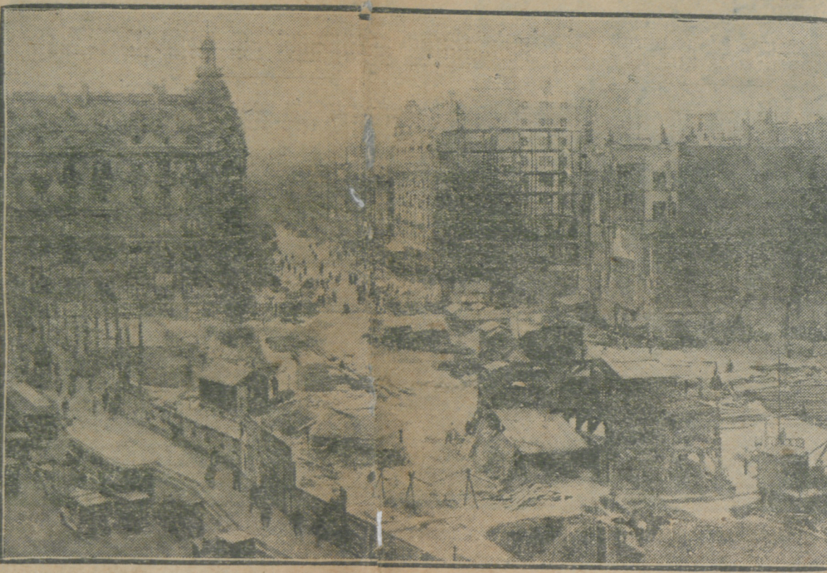
Photographia tirada do boulevard Montmartre — A esquerda, no primeiro plano, o boulevard des Ternes; á direita, os andares do metropolitano em construção, no prolongamento do boulevard Haussmann para a estação Drouot-Richelieu.

Não ha quem não sinta um grande entusiasmo patriótico ao verificar o admiravel desenvolvimento que está tendo, nestes ultimos annos, a actividade constructora no Rio de Janeiro.