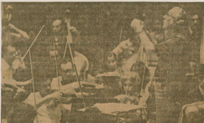
A Sinfônica tocará, esta noite, no Cultura Artística