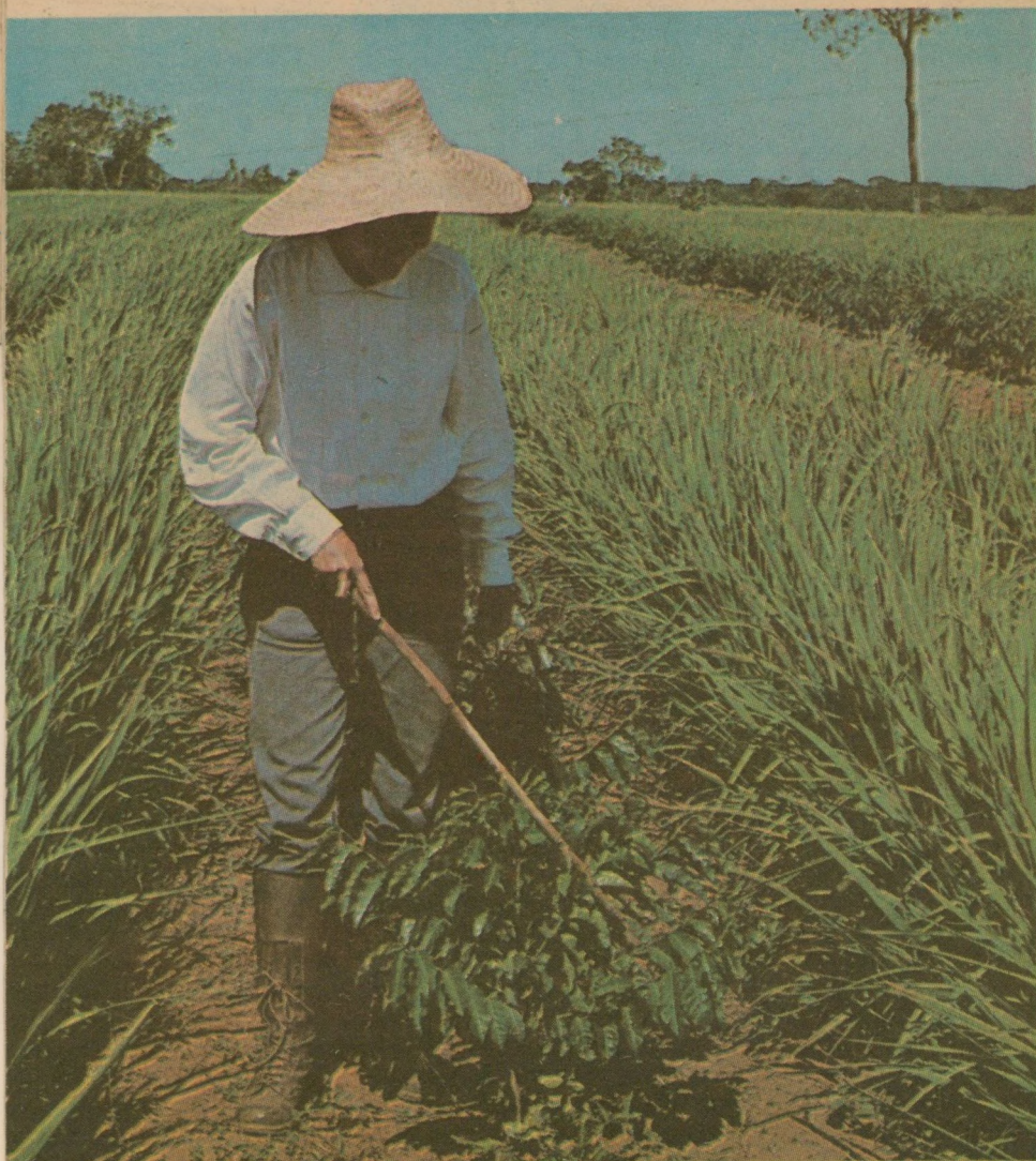
Nas páginas inferiores das fôlhas são mais evidentes os sintomas da ferrugem. Aí ocorrem a infecção e esporulação.