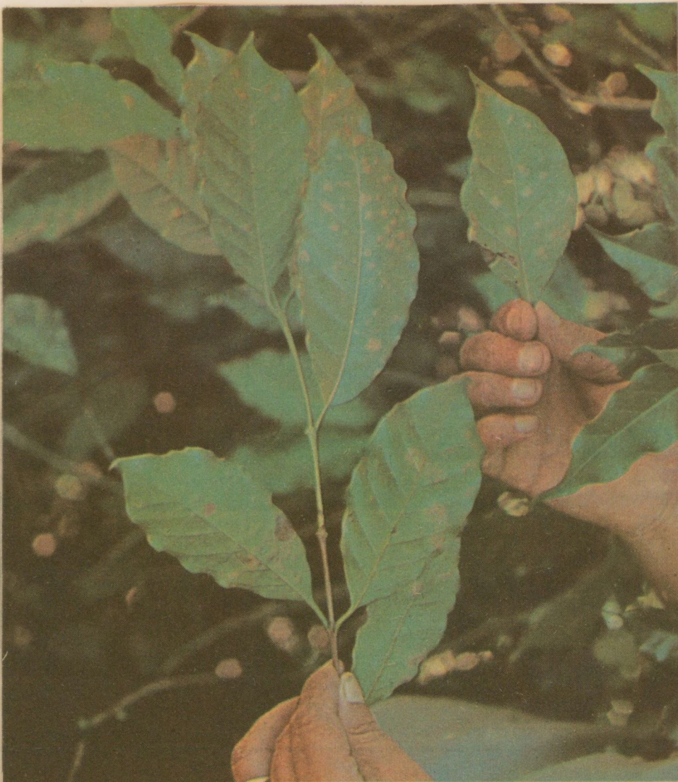
Fôlhas de cafeeiros atacadas pela ferrugem na sub-região de Franca. Vêem-se as pústulas nas páginas superior e inferior.