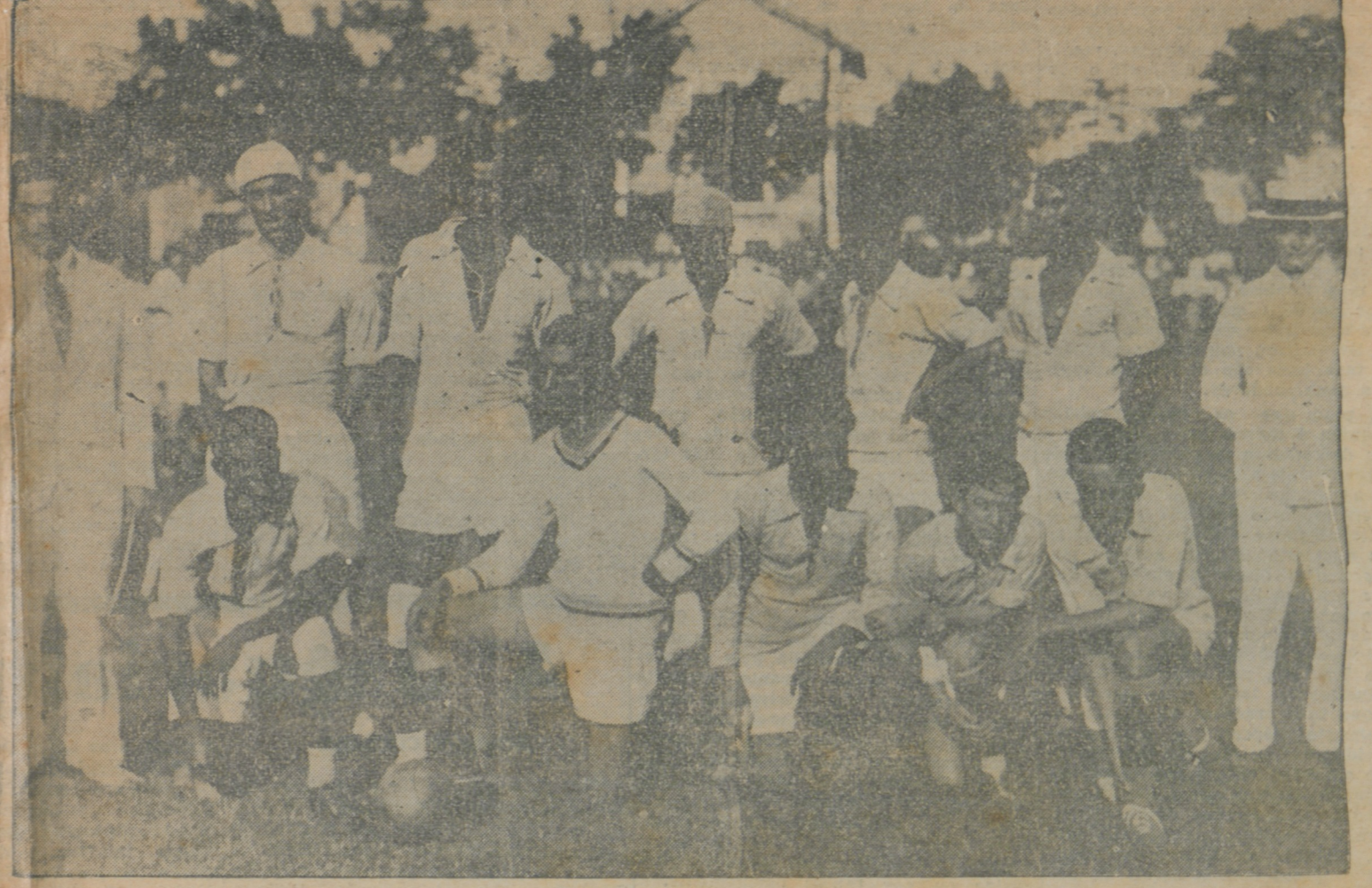
O COMBINADO DA LAF, CASTELLÕES VERSUS METROPOLITANA SENDO OS PAULISTAS VENCIDOS POR 3 A 2