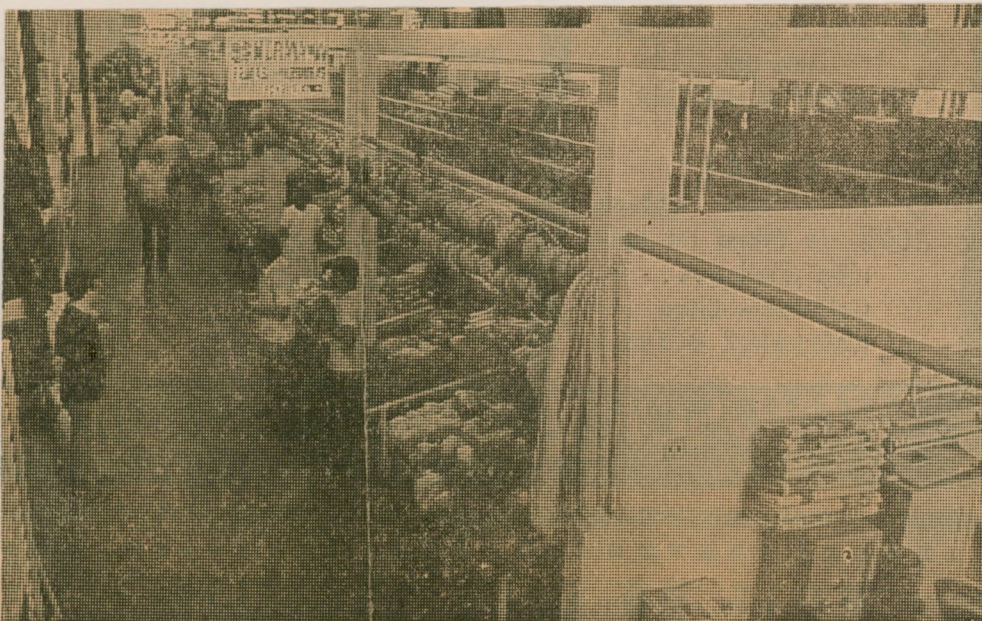
Um aspecto dos boxes padronizados que abrigam firmas comerciais